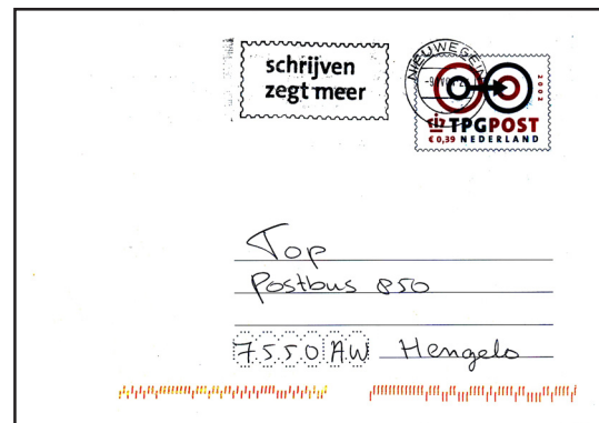
Voorbeeld van twee lineaire indexeringen

Indexeren is het omzetten van de bestemming van een poststuk in een voor een machine leesbare code: de index. In eerste instantie werd in veel landen gewerkt met een z.g. matrixindexering . Hierbij bestaat de index uit een aantal stippen of streepjes die in een bepaalde tweedimensionale ruimte op de envelop worden aangebracht.